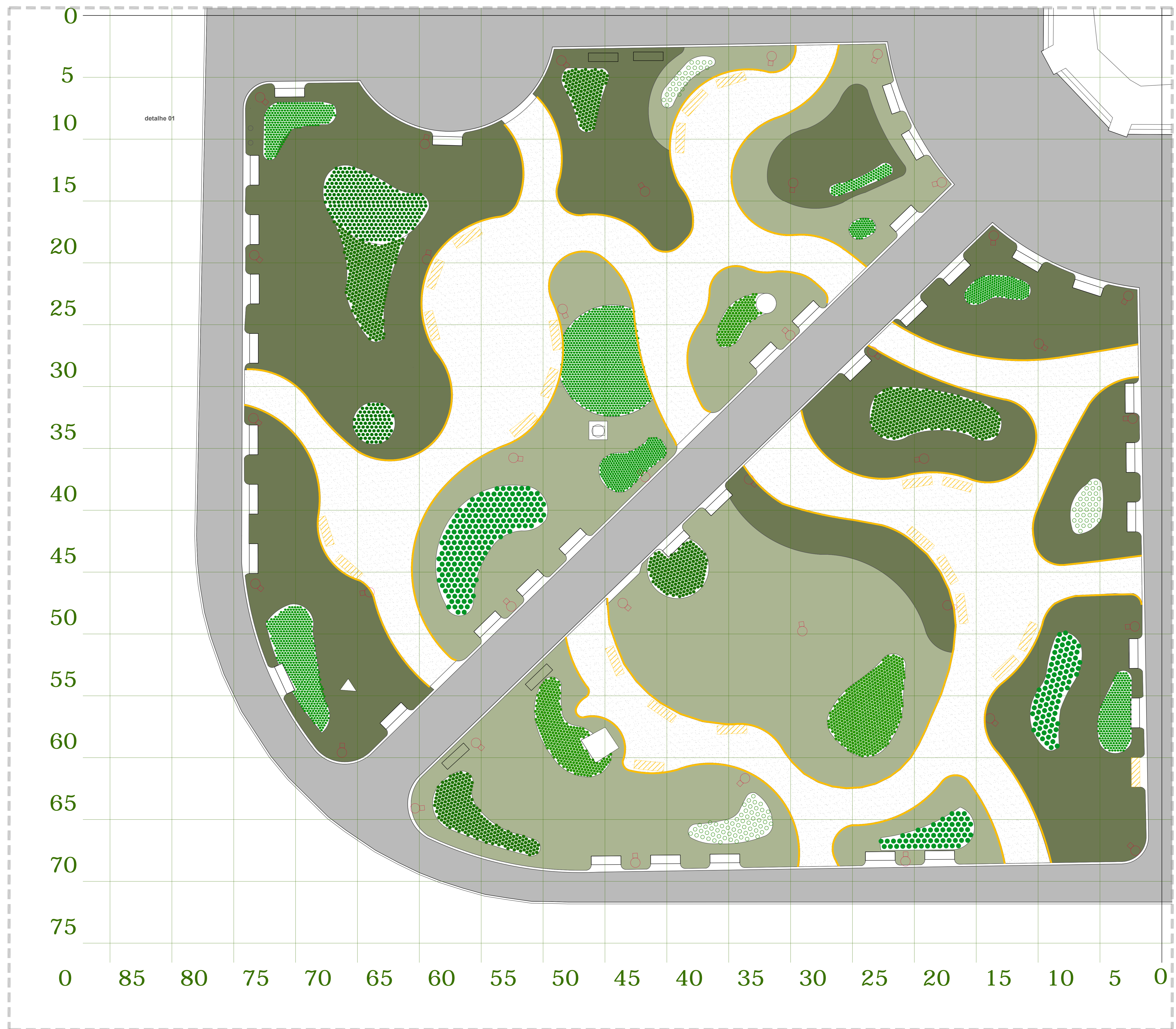
praça cel. pedro osório, detalhe dos bancos de concreto esc.: 1/100